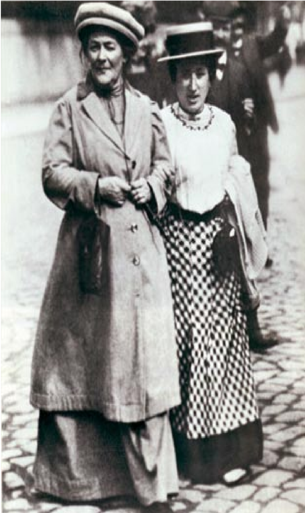
Clara Zetkin y Rosa Luxemburgo de dejar el paso franco al socialismo. El poder vivir la revolución y tomar parte en sus batallas, era para