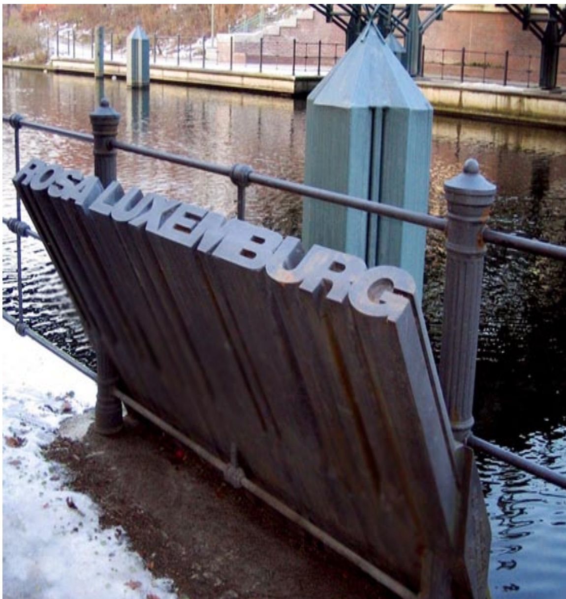
Lugar donde fue encontrado el cadáver de Rosa Luxemburgo

Luego le tocó el turno a Rosa Luxemburgo, el teniente Vogel la mató de un balazo en la cabeza y su cadáver fue arrojado a un canal. Así se cumplió su deseo de morir en el puesto de combate: "a pesar de todo, moriré, como lo espero, en mi puesto: en una huelga callejera o en el presidio" (Carta de Sonia Liebkech, 2 de mayo de 1917).