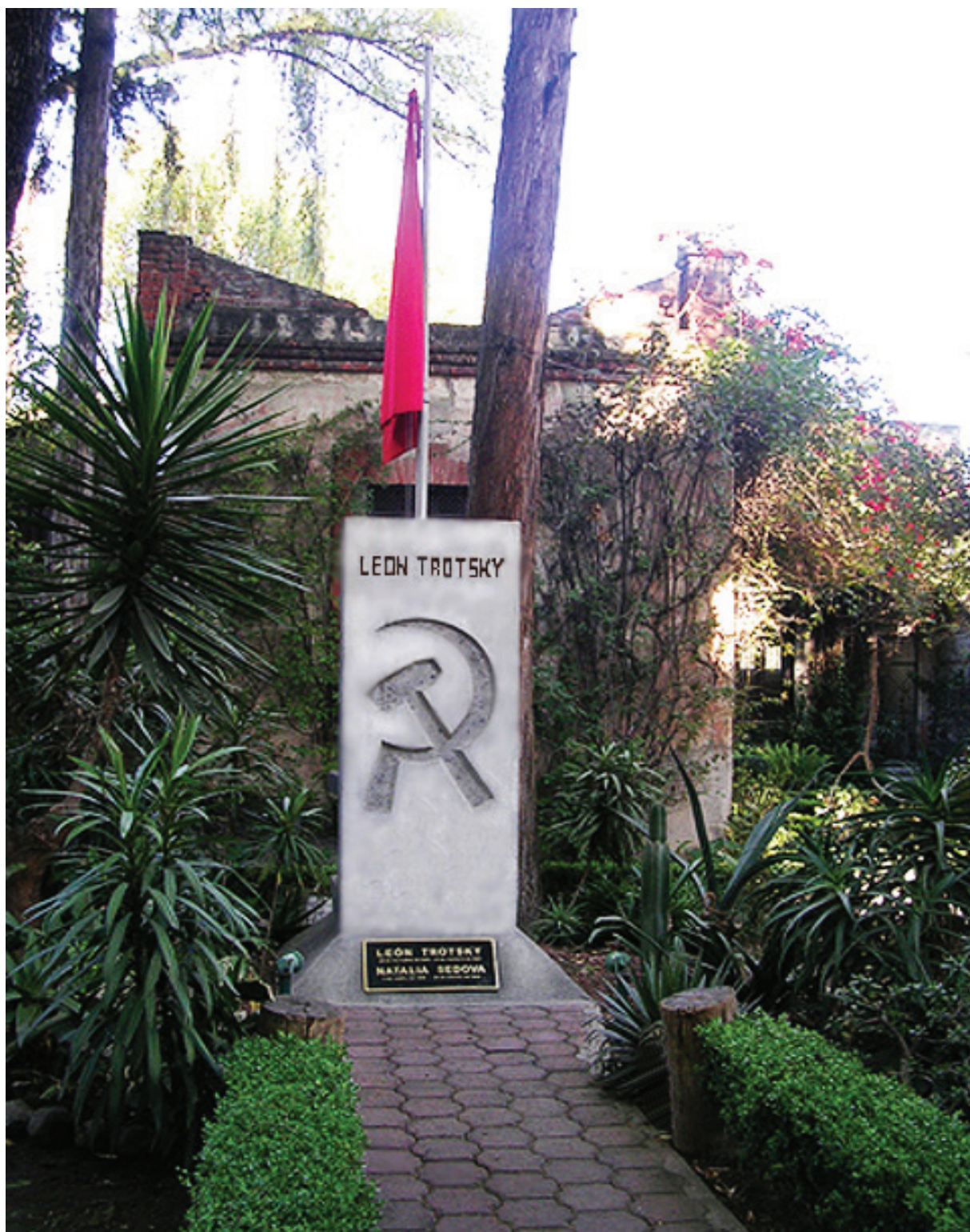
Museo de Trotsky en Mexico