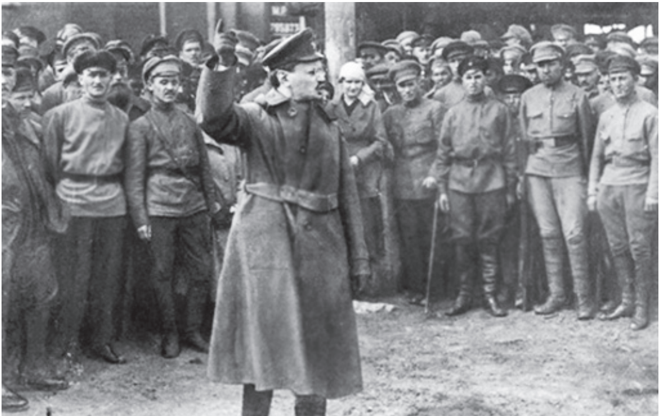
Trotsky y el Ejército Rojo