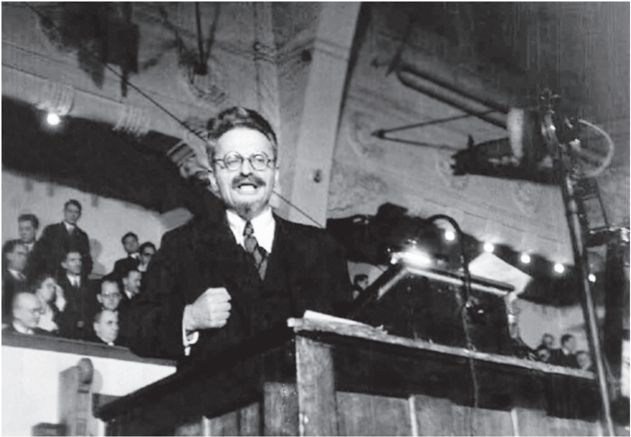
Smolyn, Leningrado 1918